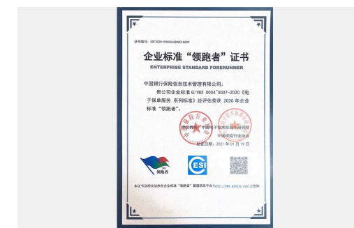
中国银保信获全国电子保单服务企业标准领跑者称号