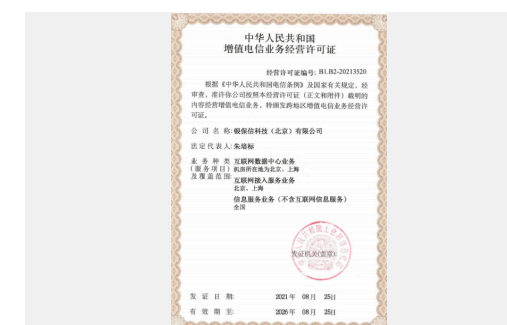
银保信科成功取得“增值电信业务”经营许可