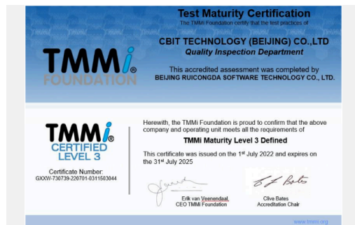
银保信科顺利通过TMMI-3级认证