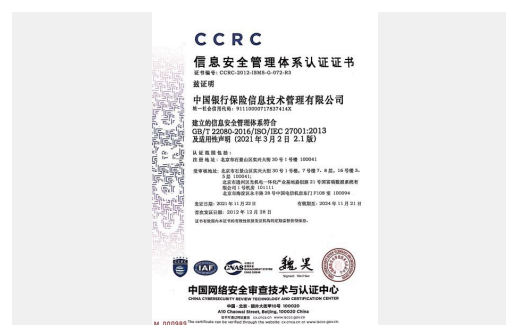
公司顺利通过ISO27001信息安全管理体系再认证