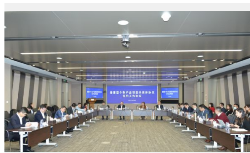
上海分公司正式成为“上海市城市定制型商业健康保险”项目信息技术保障支持单位