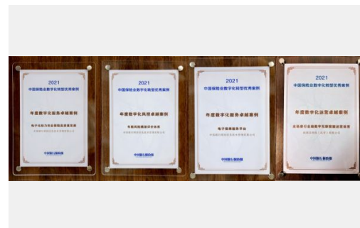
公司4项成果获评“2021中国保险业数字化转型优秀案例”