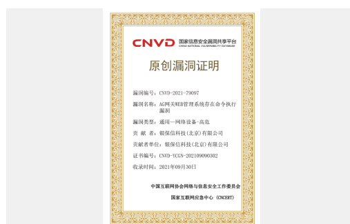
银保信科成功获得CNVD通用漏洞证书