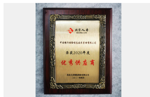
中国银保信金融销售行为管理系统荣获“北京人寿2020年度优秀供应商”