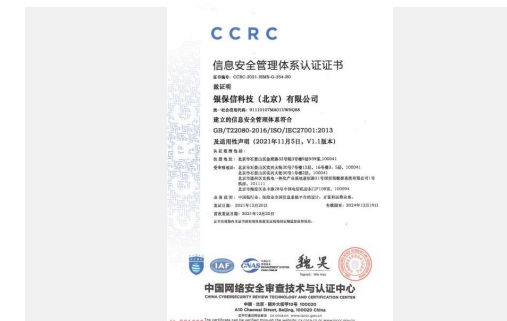
银保信科成功获取ISO27001资质证书