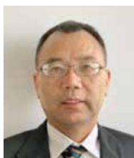
上海分公司 副总经理

1994年毕业于上海财经大学，获货币银行学硕士学位，先后就职于原中国人民银行上海市分行调查统计处、金融行政管理处、非银行金融机构监管处，原中国保监会上海监管局人身险监管处、统计信息处和法制处。